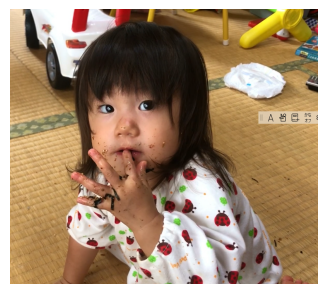
みそら 2歳弱 畳にぶちまけたふりかけ を物色中。

コロナで競技場が封鎖されることが多く、練習があまりできなかったというのがあります、とりあえず2年練習し続けていたのに、2年前とタイム変わらず。もうショック過ぎです。