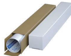
箱に入ったポスター