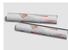
箱から出してもそのまま