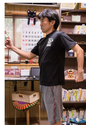
姿勢を正して 肩幅に脚を開いて腕振り